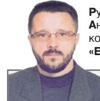
Руководитель Аналитического центра «ЕсоМ»

Необходимо формировать в обществе демократическую культуру, и проведение Аналитическим центром «ЕсоМ» первого в истории Республики Беларусь Exit poll можно считать нормой нашей демократической системы.