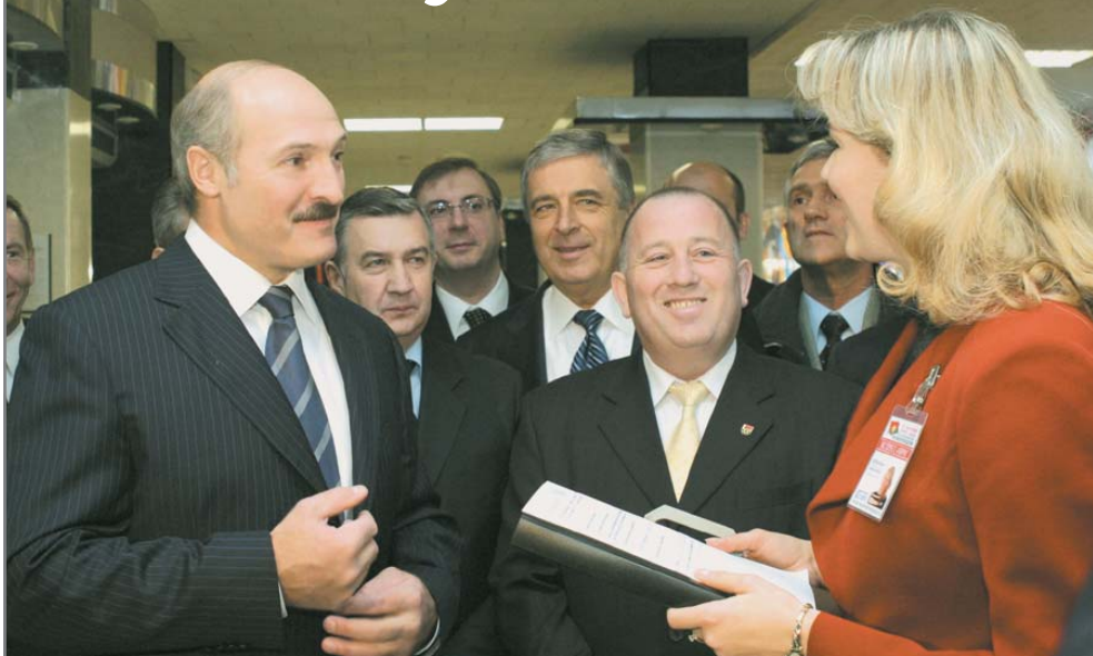
Специалисты «ЕСОМ» во время проведения первого в истории Беларуси опроса Exit poll.

«Знание не начинается ни с восприятия, ни с наблюдения, ни со сбора данных или фактов, оно начинается, скорее, с проблем».